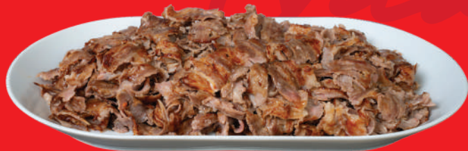
BEEF-YAPRAK DONER KEBAB